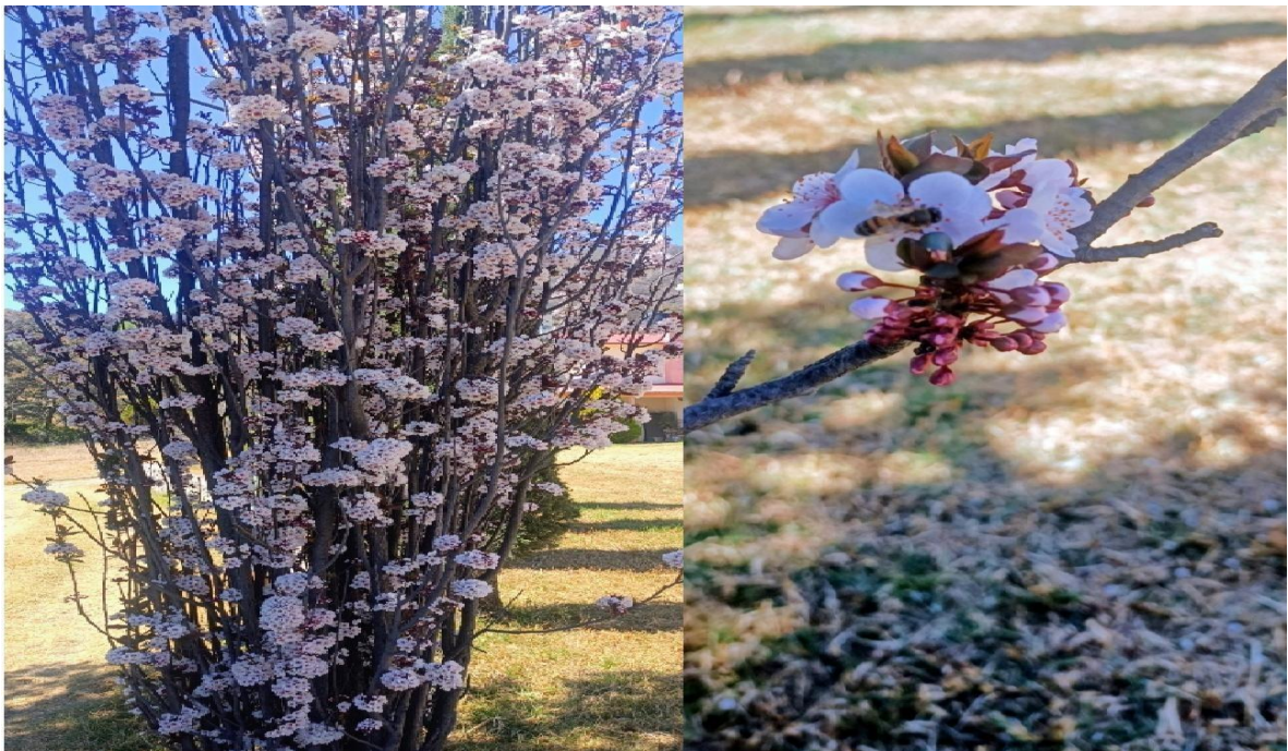
Figura 2. Ciruelo Rojo ( Prunus cerasifera ) en floración y ejemplar de Abeja melífera europea ( Apis melífera ) alimentándose de éste