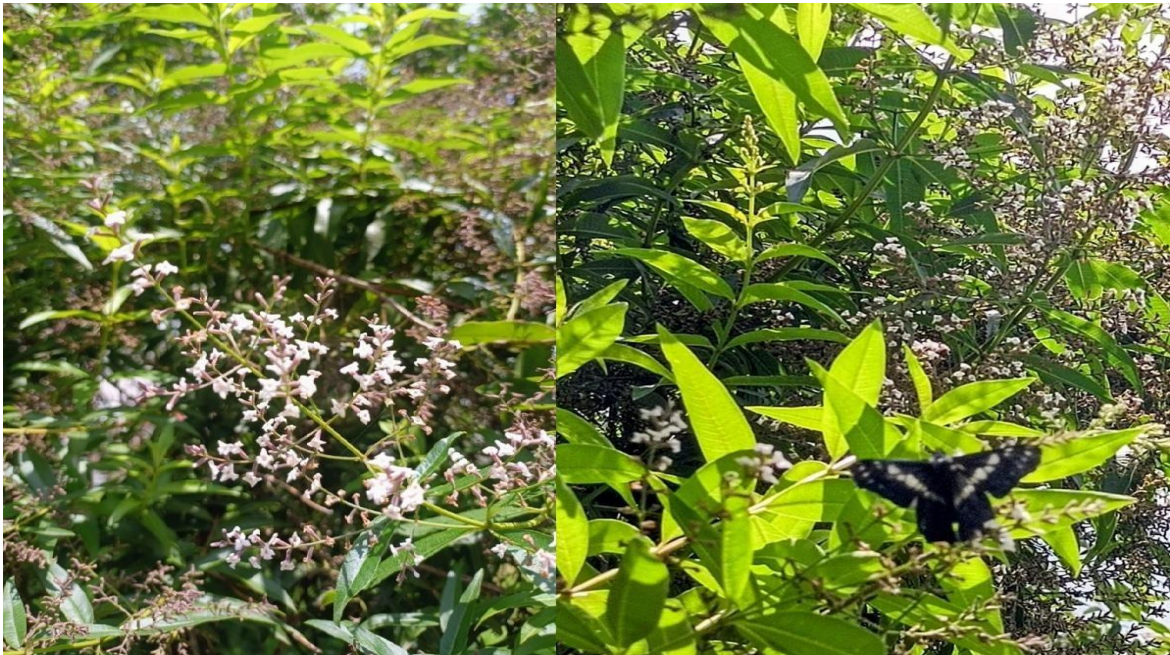
Figura 3. Floración del Cedrón ( Aloysia citrodora ) y Mariposa de Dardo Blanco de Banda Delgada ( Archonias flisa ) posada en las hojas