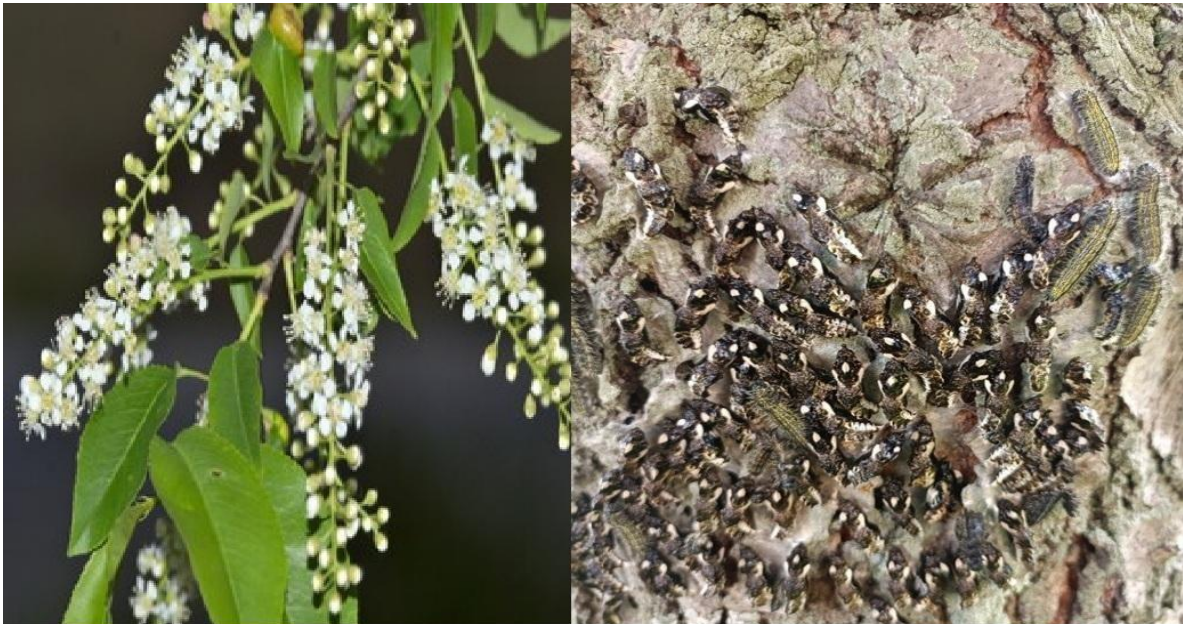
Figura 4. Floración del Capulín ( Prunus serótina ) y Mariposas del género Archonias en su etapa de pupa fijadas al tronco del Capulín

Fuente: (Barron, 2008) & (Silva Tinajero, 2022)