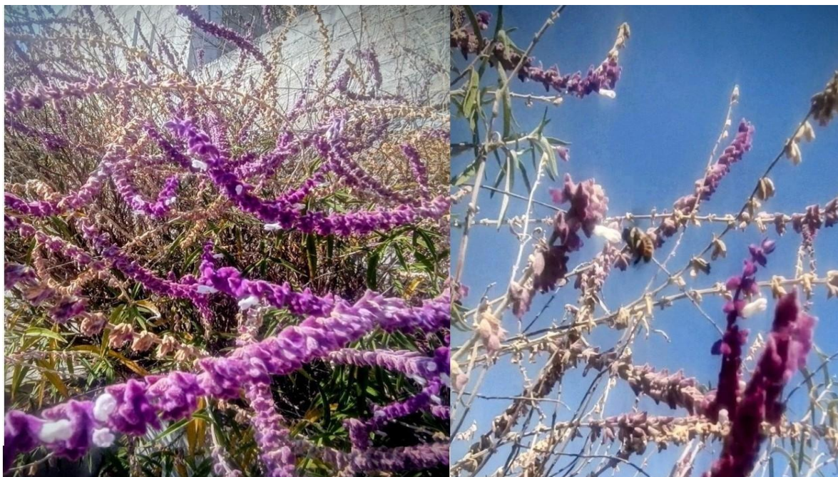
Figura 1. Floración de Salvia Cordón de San Francisco ( Salvia leucantha ) y ejemplar de Abejorro Carpintero ( Xylocopa tabaniformis ssp. azteca ) alimentándose de ésta