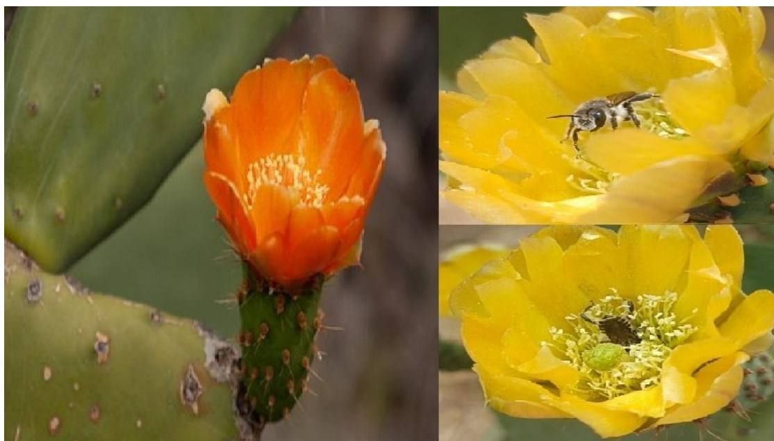
Figura 5. Floración del Nopal de Castilla y ejemplar de Abeja del género Lithurgopsis alimentándose de su flor