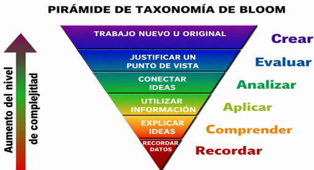
Figura 2. Taxonomía de Bloom en la Comprensión Lectora