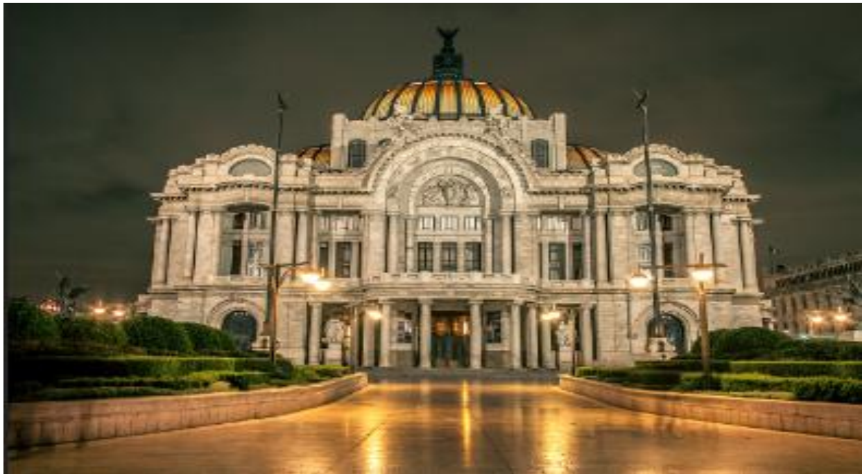
Figura 1. Vista del Palacio de Bellas Artes es un recinto cultural ubicado en el Centro Histórico de la Ciudad de México, considerado uno de los más importantes en la manifestación de las artes en México