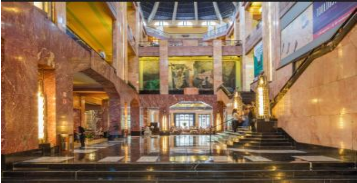
Figura 2. El Museo del Palacio de Bellas Artes es la organización que se encarga de los murales permanentes y otras obras de arte en el edificio, además de organizar exhibiciones temporales. Estas exhibiciones cubren una amplia gama de medios y presentan artistas mexicanos e internacionales, centrándose en artistas clásicos y contemporáneos